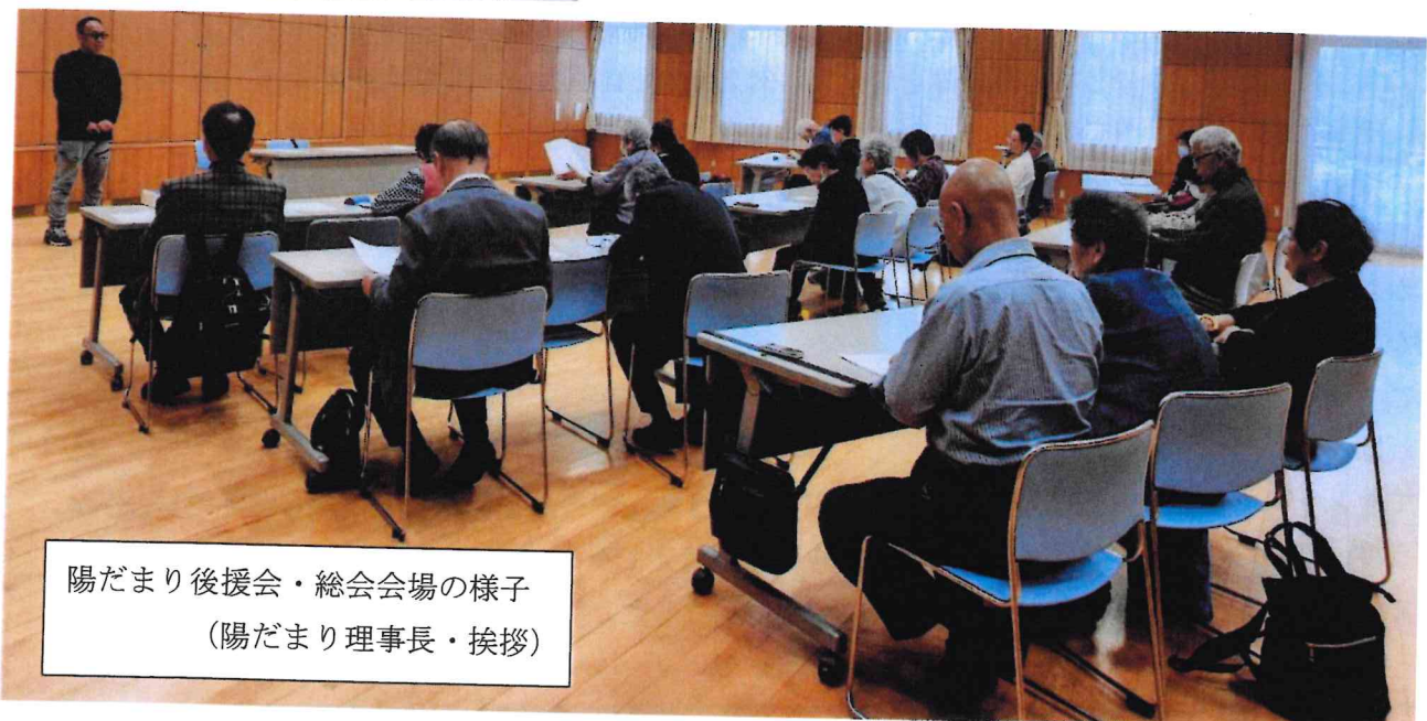
陽だまり後援会・総会会場の様子 (陽だまり理事長・挨拶)